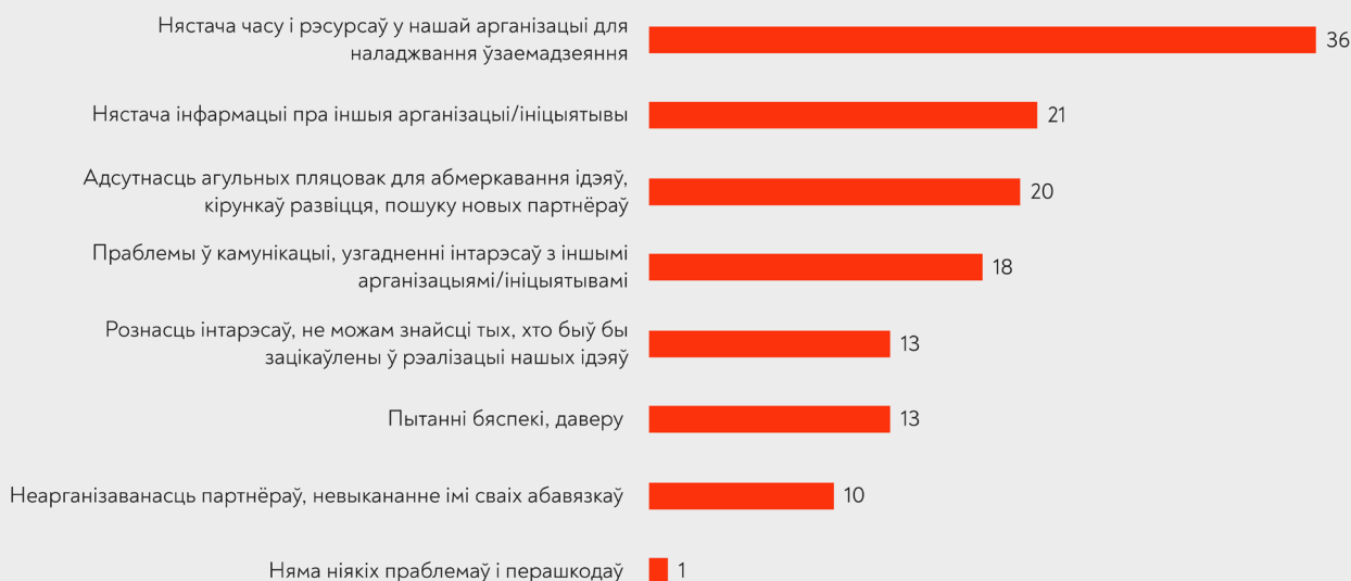
Дыяграма 1. Праблемы і перашкоды ў працэсе наладжвання супрацы паміж арганізацыямі ды ініцыятывамі 3

Адзначым, што ў апытанні 2023 году рэйтынг праблемаў быў крыху іншы: другую і трэцюю пазіцыю займалі праблемы ў камунікацыі ды ўзгадненні інтарэсаў, а таксама пытанні бяспекі. Праблемы нястачы інфармацыі і агульных пляцовак займалі месцы 4–5 паводле актуальнасці, хоць і з невялікім адрывам. Але галоўнай праблемай, якую адзначалі культурніцкія арганізацыі і ў 2023-м, і ў 2024-м, застаецца нястача рэсурсаў арганізацыяў, каб займацца пытаннямі наладжвання ўстойлівых сувязяў і супрацы з іншымі актарамі культурнага поля.